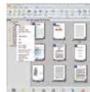
PaperPort SE 14 使用界面

PaperPort SE 14 是一個可以迅速將堆積如山的文件及照片數位化，並讓你迅速在網路上搜尋、使用及分享這些數位文件的軟體。有了PaperPort SE 14，從此不需要在堆積如山的文件中，辛苦地找尋你要的文件了。PaperPort SE 14讓文件的數位化變得輕鬆又容易，因為它可以迅速地多頁的文件轉成非常普遍的可攜式文件格式 PDF、或JPEG、及其它圖檔格式等，並讓你將圖檔直接用拖拉的方式連結到其他的應用軟體，非常方便好用而不需花額外的時間學習，是家用與小型辦公室影像處理的最佳選擇！